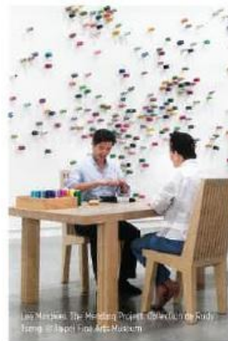
Las Menas, The Meeting Project, Collaboration of Kimsooja and Tapet Fine Arts Museum