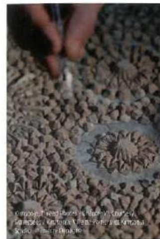
Kimsooja, Thread, Thread as Paper, V, Courtesy of Kimsooja, Kimsooja, Milan, Poitiers and Kimsooja Studio. | Christy Demuth