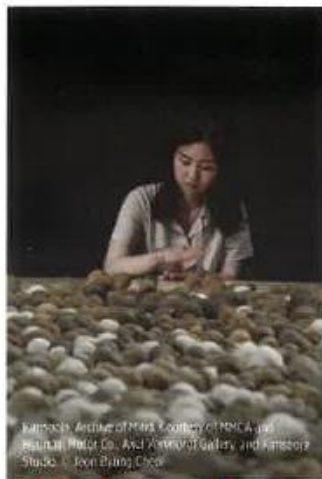
Kimsooja, Archive of Marks, Courtesy of HMC A and Museum, Hotel Co., Axel Vonderhof Gallery, and Kimsooja Studio. | Joon Young Choi

RETROUVEZ TOUT LE PROGRAMME SUR traversees-poitiers.fr