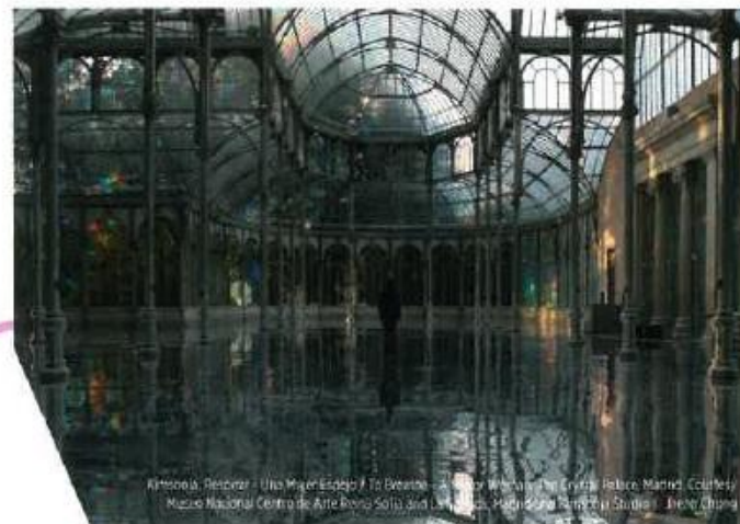
Kimsooja, Relicario - Una Magia Española / To Breathe - A Body Without The Crystal Palace, Madrid. Courtesy Museo Nacional Centro de Arte Reina Sofía and Kimsooja, Madrid and Kimsooja Studio. | Joon Young Choi