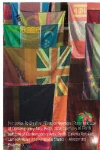
Kimsooja, To Breathe, Zone of Powers, Perth Institute of Contemporary Arts, Perth, 2018.