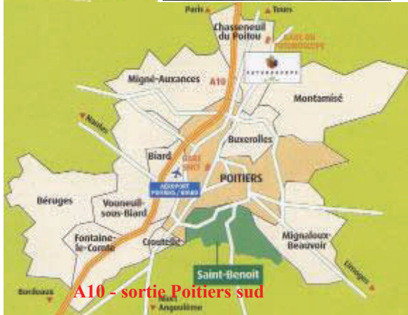
A10 - sortie Poitiers sud

Sensations garanties pour ce stage, à la découverte ou au perfectionnement de différents sports .