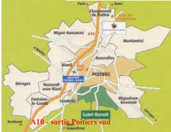
A10 - sortie Poitiers sud

Sensations garanties pour ce stage, à la découverte ou au perfectionnement de différents sports .