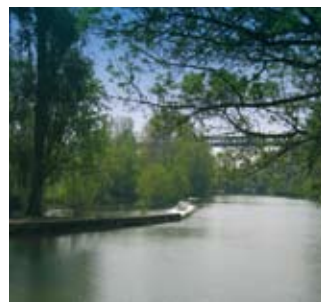
Le Clain