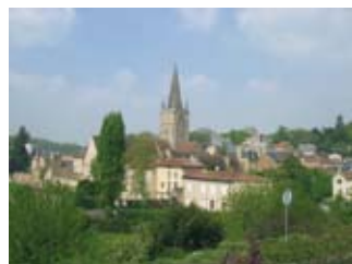
Bourg de Saint-Benoît

➔ RDV Dortoir des Moines, Abbaye de Saint-Benoît, rue Paul Gauvin - Accès libre.