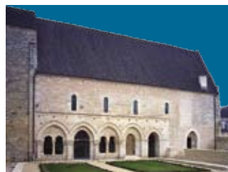
Bâtiment conventuel

➔ RDV devant l'Office de Tourisme de Saint-Benoît, rue Paul Gauvin.